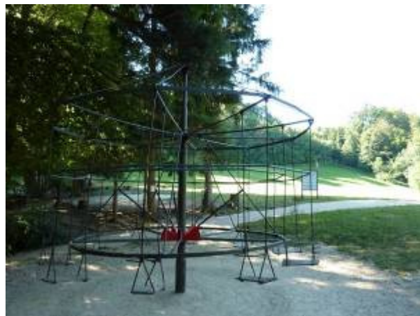
Hofstettermatte mit div. Spielgeräten