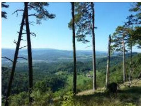
auf dem Blauen