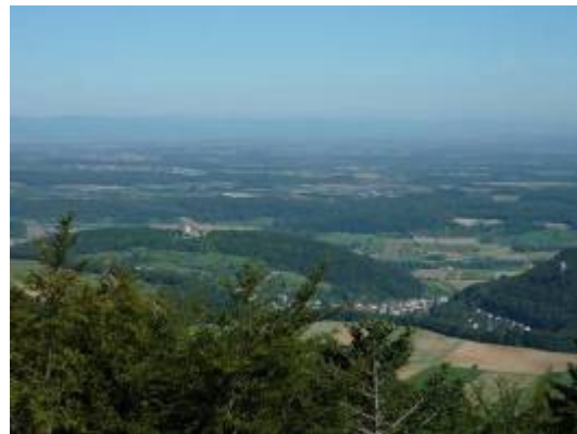
Aussicht über die Landskron zu den Vogesen