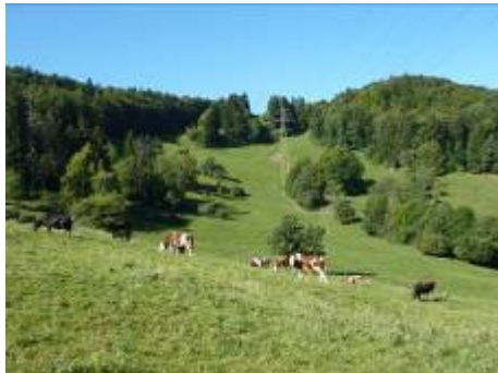
im Aufstieg zum Blauenpass